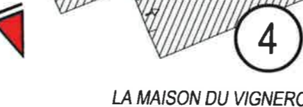
LA MAISON DU VIGNERON